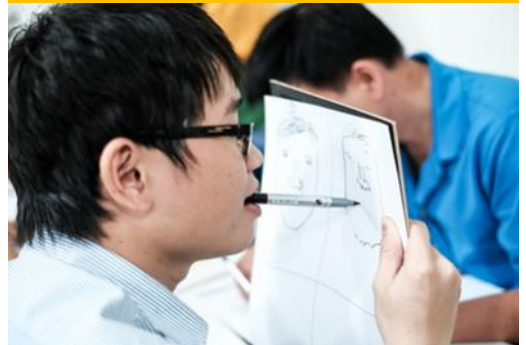
Một cách vẽ trong trò chơi

Mở đầu là hoạt động vẽ lẫn nhau. Các bạn được sắp xếp ngồi theo cặp đối diện nhau, vẽ về người đối diện mình theo 4 cách khác nhau (nhìn và vẽ bằng tay phải, nhìn và vẽ bằng tay trái, nhìn chăm chăm không liếc xuống giấy và vẽ, nhìn rồi nhắm mắt vẽ). Hoạt động này giúp các bạn trải nghiệm việc vẽ “khác thường”, để hiểu rằng có những điều thú vị nếu chúng ta thay đổi góc nhìn, cách cảm nhận; cũng như là cách để các bạn quan sát người bạn mới của mình.