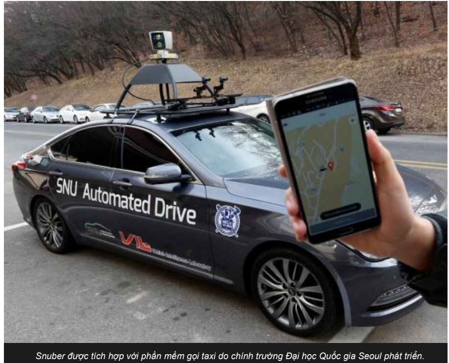
Snuber được tích hợp với phần mềm gọi taxi do chính trường Đại học Quốc gia Seoul phát triển.