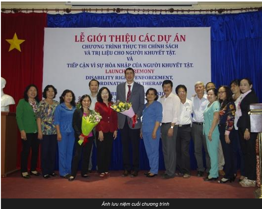
Ảnh lưu niệm cuối chương trình